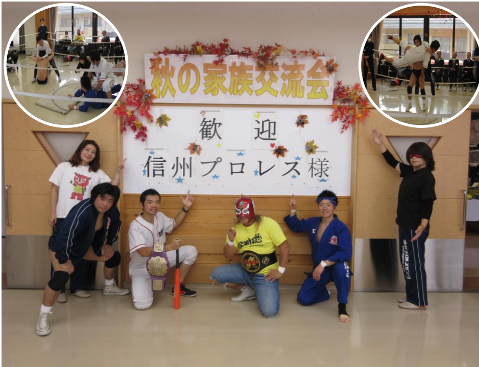
今年の秋の交流会は信州プロレスの皆さんに来ていただきました。