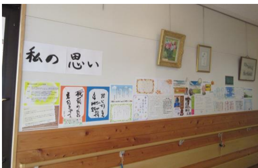
利用者さん達が普段考えている事、思っていることを紹介しました。