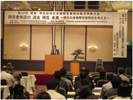
菅谷市長様に講演して頂きました。