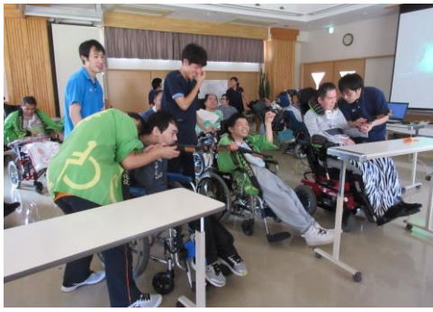
本格的な射的を楽しみました。

楽しい夏祭りが今年もやってきました。今回の祭りは、小さい頃やったことがある人も多いだろう祭りの定番「射撃ゲーム」が目玉です。この日の為に弾が柔らかい素材で安全かつ本物さながらの撃ち応えのあるおもちゃの銃を用意しました。射撃の的にも工夫を凝らし、利用者の好きなキャラクター（演歌歌