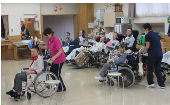
最後まで白熱した展開でした。

ートを美味しく食べて頂きました。前記の結果より、今年の大みそかの紅白歌合戦は白組の勝利ではないかと思わせるような運動会となりました。利用者さんからも大変楽しかったとの話を頂き、有意義な時間を過ごして頂いたのではないかと嬉しく思いました。