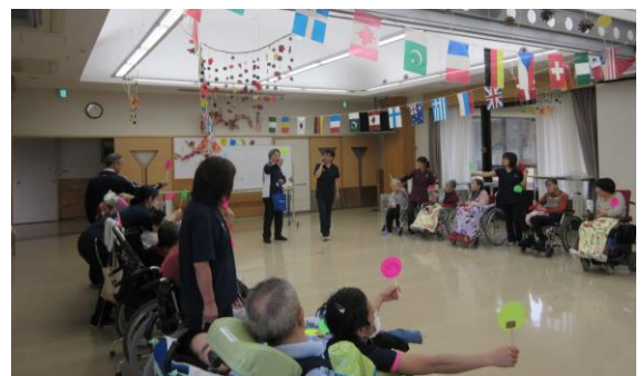
定番のジャンケン大会から始まりました。

十月十七日に利用者様参加による秋の運動会を開催致しました。当日は旭ヶ丘中学校の学生さん三名が体験実習に来ており、一緒に参加して頂きました。競技は、じゃんけん大会に始まり、運試しゲーム・利用者様職員一体となった仮装リレ