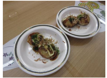
射的の後にたこ焼きを食べました。

手・有名アイドル・アニメキャラなど）を的として二十体以上も用意しました。そして当日、会場は大盛り上がり。職員と一緒に協力して撃つ利用者、自分で弾補充から発射まで行う利用者、好きなキャラを当てて喜ぶ利用者、順番を今か今かと待つ利用者……。射撃を楽しむお声で会場は埋めつくされていきました。「銃に迫力があって面白い」「どれを狙おうか選ぶのが楽しい」といつもと違う非日常感を味わっていました。職員も童心に返り一緒に楽しむ事ができました。その後はたこ焼きをお腹いっぱい食べて、スクリーンに映る花火の映像を見ながら夏を満喫する事ができました。この日は夏の終わりがちよっぴり切なくなるほど思い出が沢山増えました。